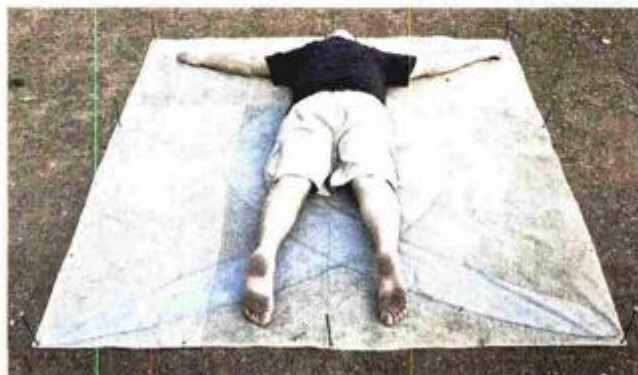
Kipke je snimio film "Srebrno, srebrenije od srebrnog"

POREČ - Valamar hotel i resort u Poreču domaćin je i partner jedinstvenog projekta "Umjetnik na odmoru", koji je pokrenuo kolekcionar Marinko Sudac u organizaciji Instituta za istraživanje avangarde, a pod visokim pokroviteljstvom Ministarstva kulture održava se po drugi put u Hrvatskoj. Tijekom srpnja i kolovoza u Valamarovim objektima borave neki od najistaknutijih svjetskih autora na području suvremene umjetnosti i radikalnih praksi